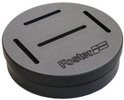
Porte-couteaux 8100 030